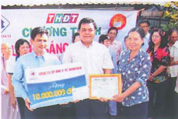
Chương trình “Gương sáng hiếu học”

Thực hiện tinh thần “Tương thân tương ái”, Công đoàn cơ sở Công ty đã tiếp tục phát động phong trào nuôi heo đất với chủ đề “Chia sẻ yêu thương” từ các tổ công đoàn, tổng số tiền thu được năm 2016 là 346.657.000 đồng, số tiền này đã được sử dụng để hỗ trợ cho người lao động có hoàn cảnh khó khăn; đồng thời trong năm đã hỗ trợ cho công đoàn viên xây dựng 07 căn nhà mang tên “Mái ấm DOMESCO”, với trị giá là 50 triệu đồng/căn nhà. Ngoài ra, Công ty cũng đã có nhiều chính sách cho con em CB-CNLD như: tổ chức vui Trung thu, hỗ trợ học phí đầu năm học cho 21 em có tinh thần vượt khó học giỏi; khen thưởng con CB-CNLD đạt thành tích cao trong học tập; khen thưởng và tuyên dương 05 em trúng tuyển vào các trường Đại học với số tiền hơn 104 triệu đồng.