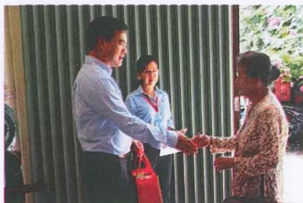
Thăm hỏi Mẹ Việt Nam anh hùng