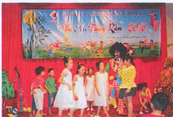
Vui hội trăng rằm cho các em thiếu nhi