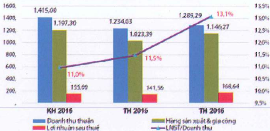
Biểu đồ Doanh thu - Lợi nhuận

Lợi nhuận sau thuế hợp nhất vượt kế hoạch 8,8% và tăng trưởng ở mức 19,1% so cùng kỳ; chỉ số ROS tăng từ 11,5% lên mức 13,1%.