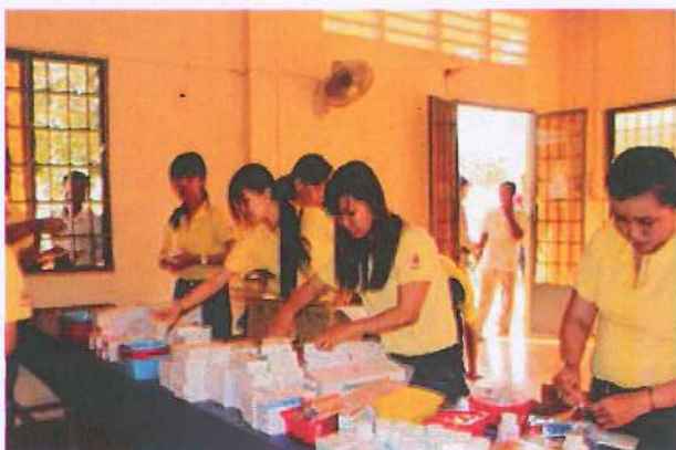
Chương trình cấp phát thuốc miễn phí