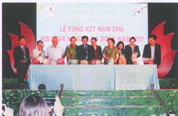
Tổng kết chương trình nuôi heo đất