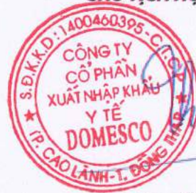
Nguyễn Chí Thành