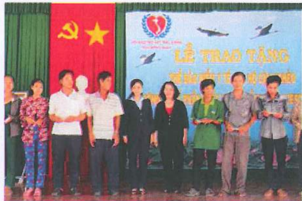
Chương trình trao thẻ bảo hiểm y tế cho người hộ cận nghèo